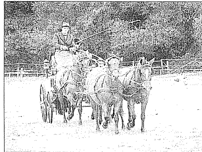
... und im Wettbewerb mit Gespann